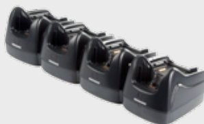
• 94A150037 Vierfach Lade-/Übertragungsstation • 94A150038 Vierfach Ethernet Station