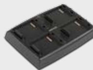
• 94A150039 Vierfach Akkuladestation