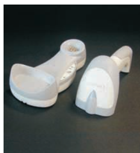
Im Uhrzeigersinn: Stand-, Tisch- und Wandhalter für den Gryphon™